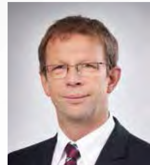
Klaus Mohrs Oberbürgermeister