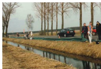
Aufbau eines provisorischen Amphibienschutzzaunes

Trotz aller Erfolge: Die Schutzmaßnahmen stellen häufig nur ein Provisorium dar. Die Schutzzäune werden nur zur Laichzeit im Frühjahr aufgebaut, spätestens Ende Mai müssen sie wieder abgebaut werden. Dies bedeutet, dass nur die ausgewachsenen geschlechtsreifen