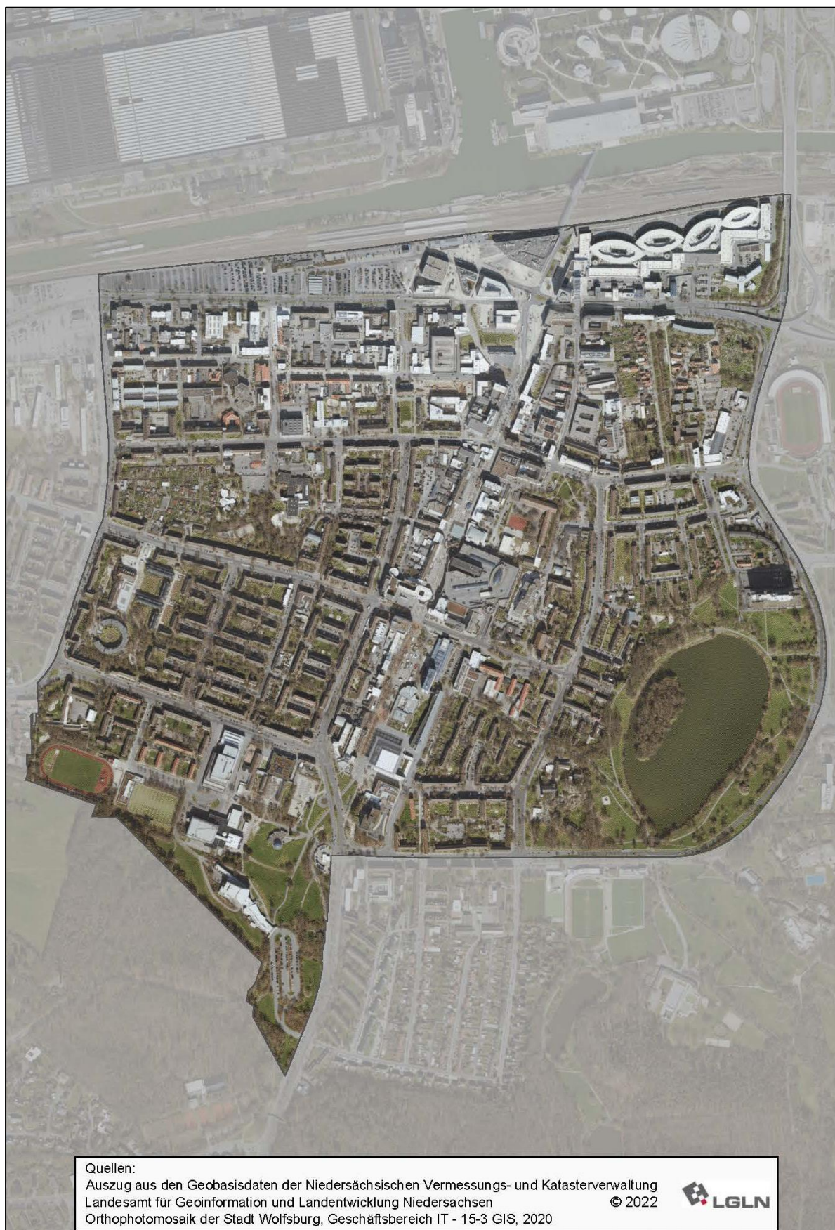
Abbildung 1: Programmraum