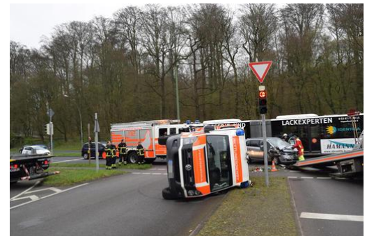
Abbildung 2 VU RTW