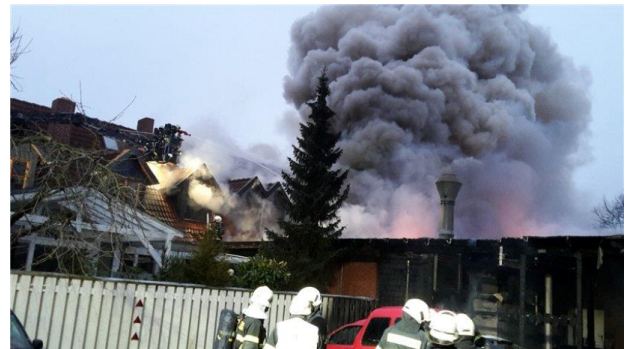
Abbildung 1 Feuer Tischlerei