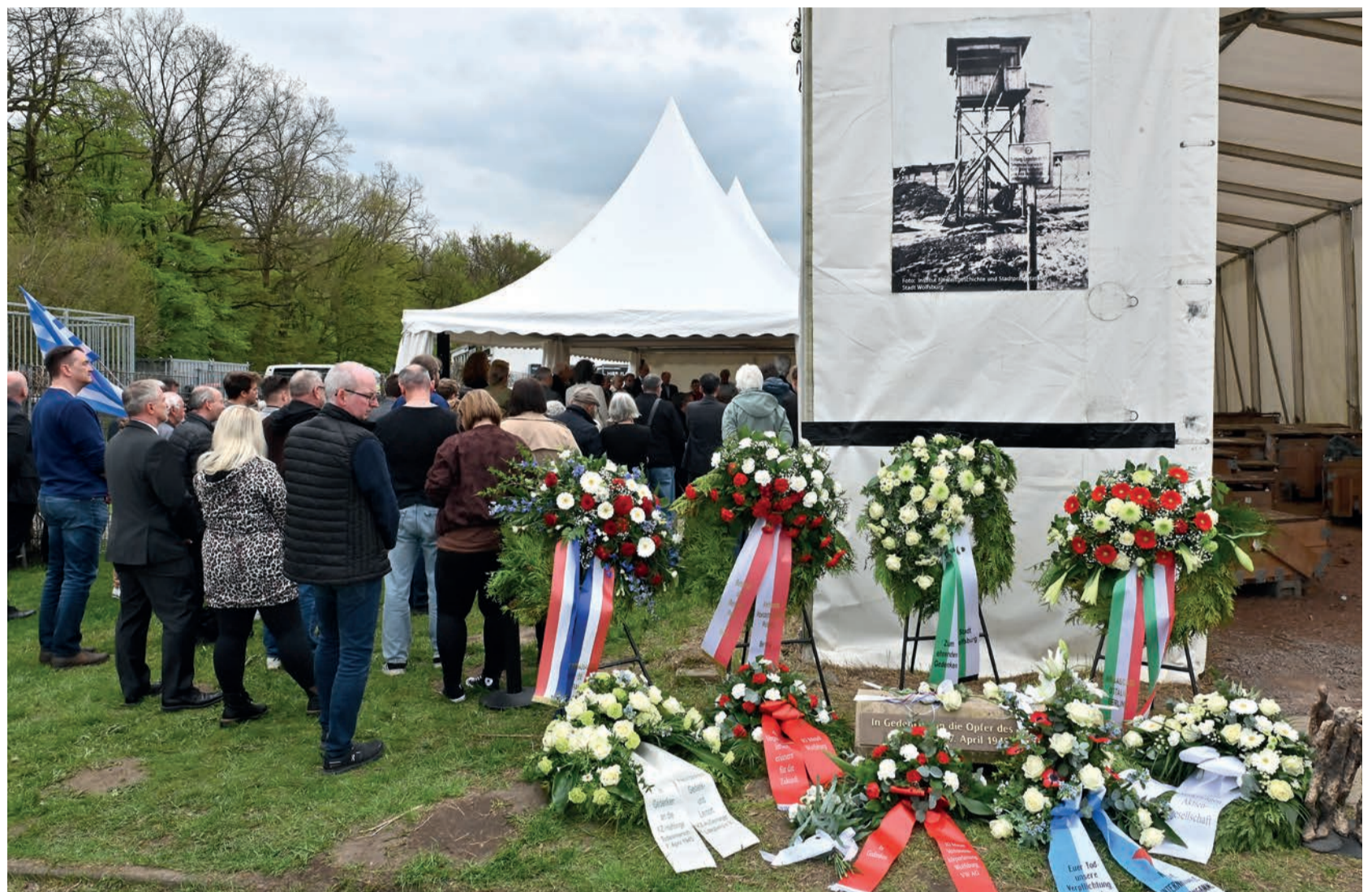
Nach den Kranzniederlegungen am Gedenktag für die Opfer des Todesmarsches vom 7. April 1945, Laagberg, am 16. April 2026; Foto: Lars Landmann/StadtA WOB, S. 8/#296348

In ihrer Dissertation untersucht Thordis Kokot die Alltagswelten und politischen Aktivitäten von Arbeitsmigrantinnen aus Griechenland in der Bundesrepublik, weshalb wir sie gebeten haben, zwei migrationsgeschichtliche Oral-History-Interviews des IZS für diese Ausgabe unter eben diesen Gesichtspunkten zu analysieren.