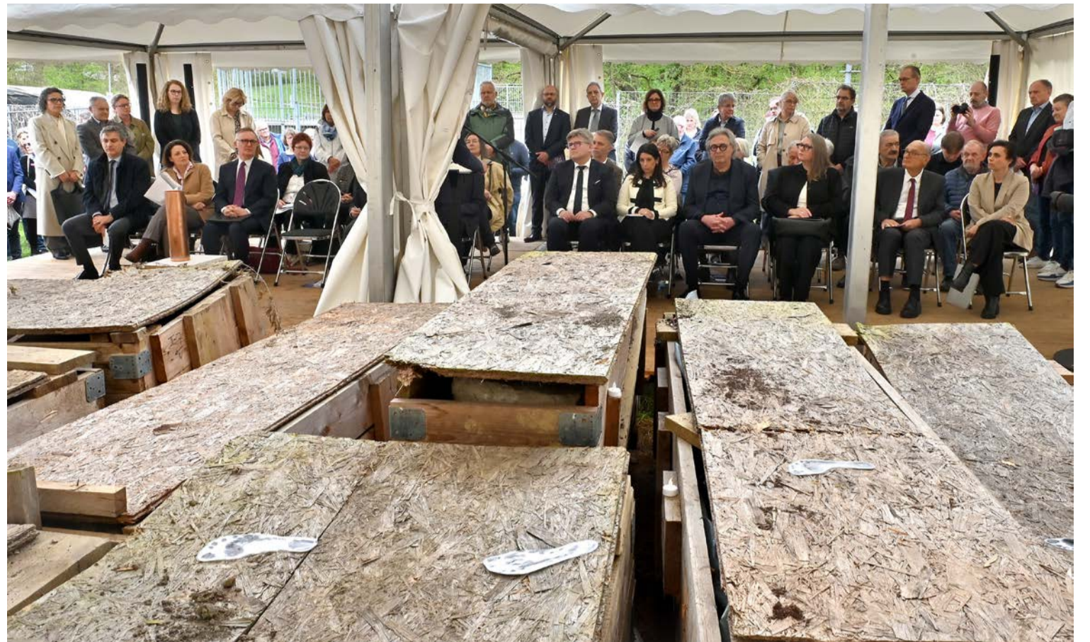
Die Gedenkfeier an die Opfer des Todesmarsches, 16. April 2026