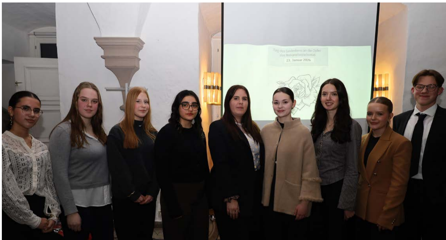
Verantwortliche Jugendliche für das Jugendprojekt zum Tag des Gedenkens an die Opfer des Nationalsozialismus