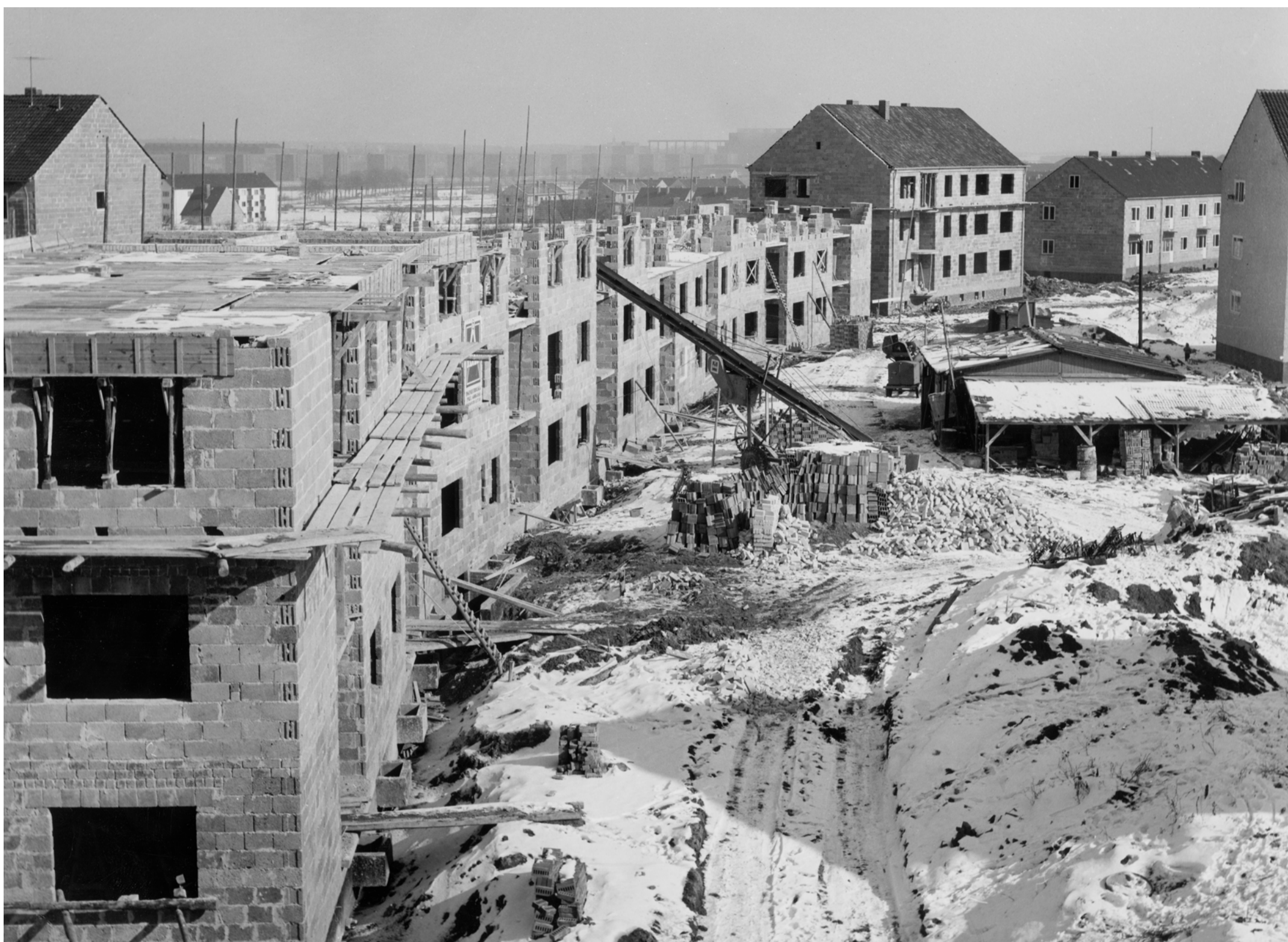
Wohnungsbauten der Neuland in der Danziger Straße im Stadtteil Wohlberg, 1955; Foto: Willi Luther/StadtA WOB, S.8/#71297