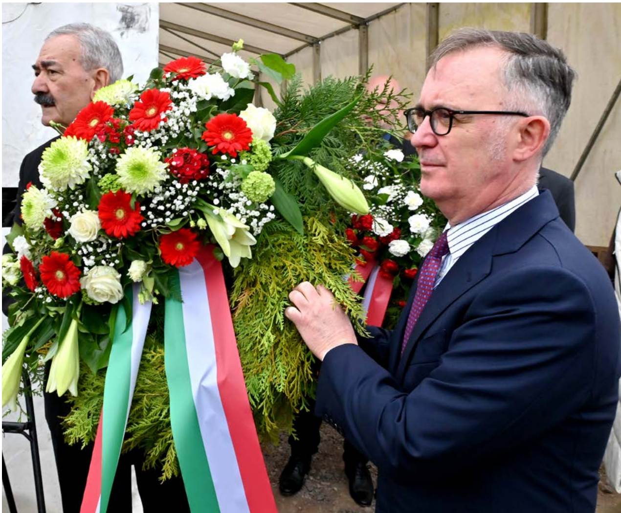
Der italienische Botschafter S.E. Fabrizio Bucci während der Kranzniederlegung, 16. April 2026; Foto: Lars Landmann/StadtA WOB, S. 8/#296302

„Wenn die anderen glauben, man ist am Ende, so muss man erst richtig anfangen“, sagte Konrad Adenauer. Wenn alle meinen, eine neue, auf Macht basierende Weltordnung sei die einzig mögliche, ist es an der Zeit, das europäische Modell mit Nachdruck zu bekräftigen. Im Zentrum dieses Modells steht nach wie vor eine Idee von großer Bedeutung: der Vorrang der Politik des demokratischen Handelns. Denn, wie Alcide De Gasperi sagte: „Die Zukunft wird nicht durch Gewalt oder Eroberung geschaffen, sondern durch die geduldige Umsetzung der Demokratie, das konstruktive Streben nach Konsens und die Achtung der Freiheit.“