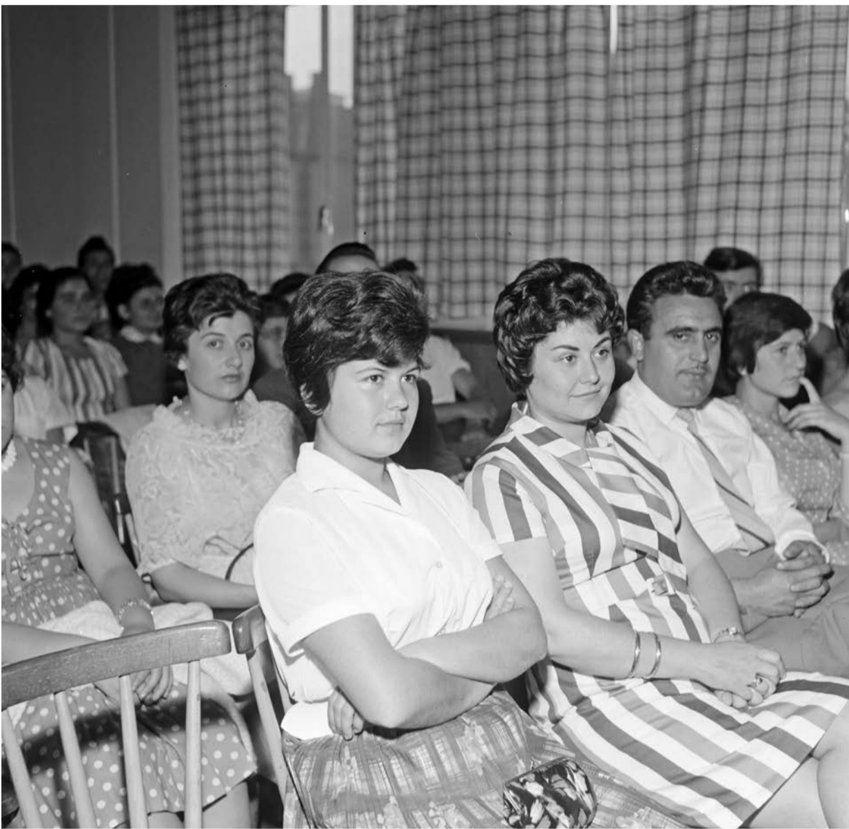
Abb. 4: Griechischer Abend der Glanzstoff AG, 1962

ren oftmals die tatsächliche Vielschichtigkeit der Migration. 11