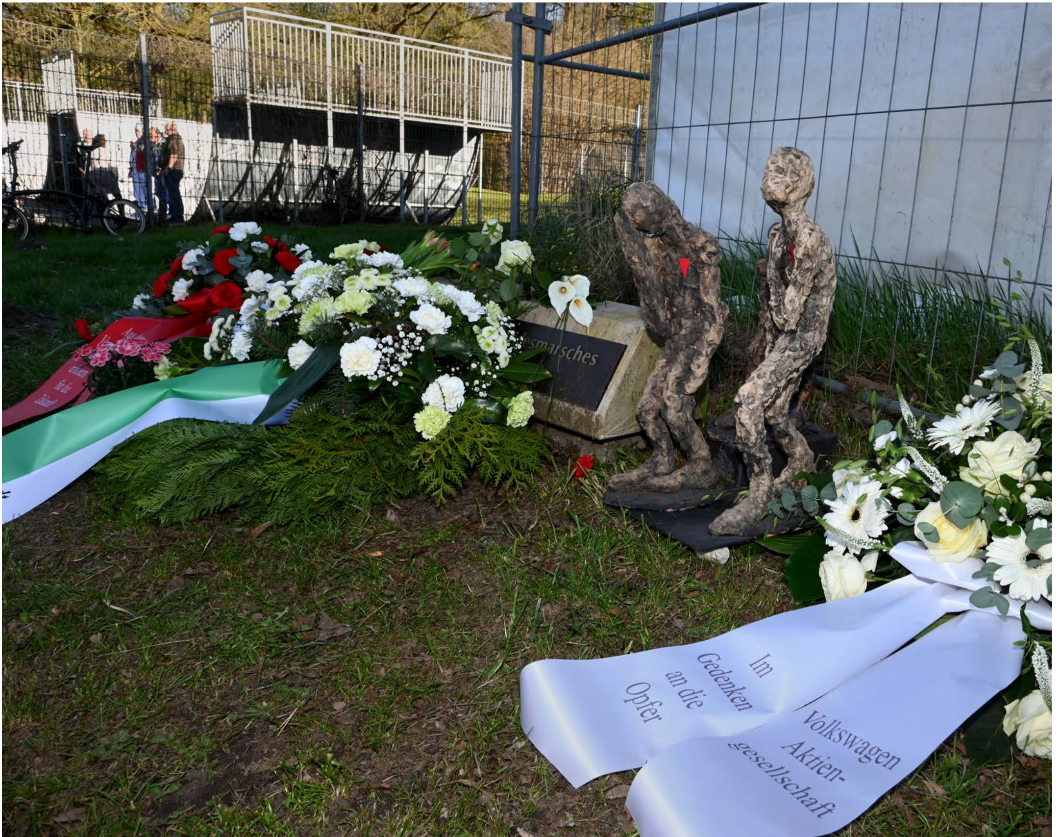
Kranzniederlegung Gedenkstätte KZ-Außenlager Laagberg, Stadt A WOB; S 8, Foto: Lars Landmann