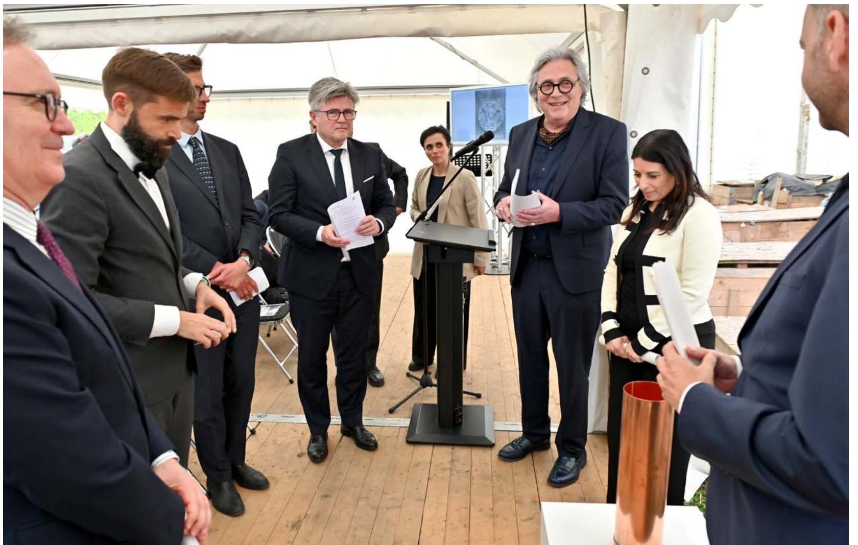
Das Befüllen der Zeitkapsel, 16. April 2026