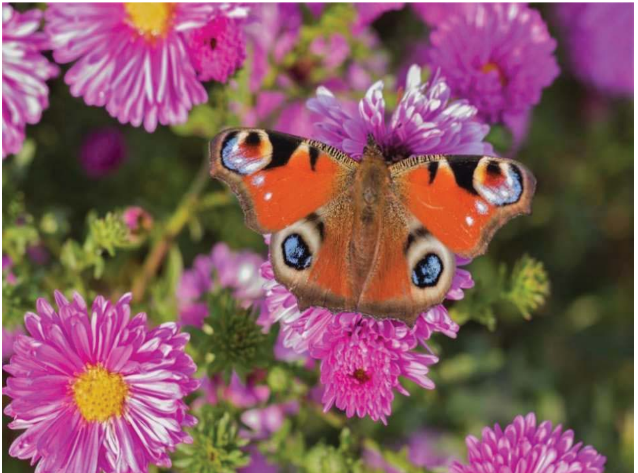
Tagpfauenauge auf Aster