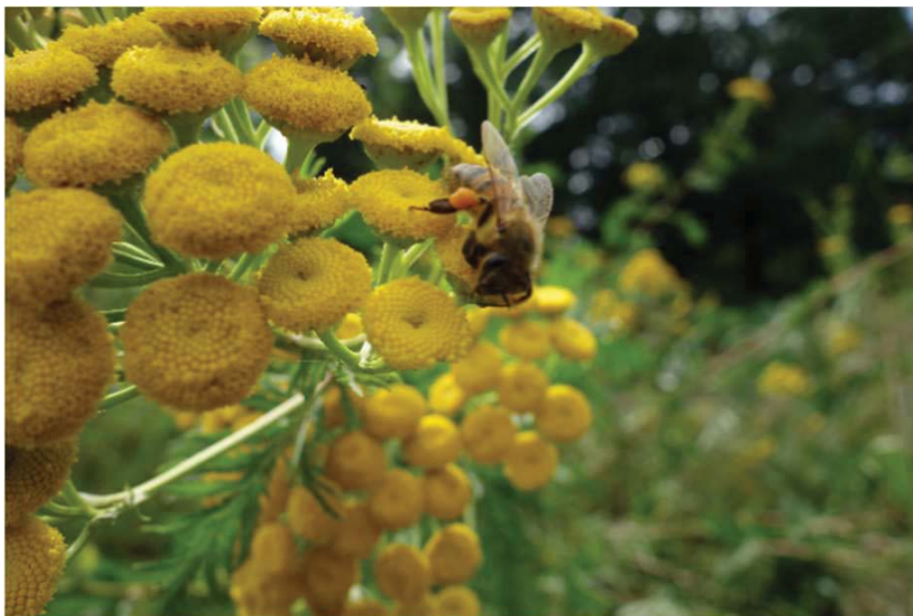
Biene auf Rainfarn

Als Blütenbestäuber sorgen Insekten für die Vielfalt von Pflanzen und Tieren. Im Obstanbau ist das wertvolle Zusammenspiel von blütenbesuchenden Insekten und Ertrag am deutlichsten sichtbar. Ohne die Bestäubung der Apfelblüten im Frühjahr durch Bienen, Hummeln und Wildbienen gäbe es im Herbst nur wenige und minderwertige Äpfel. Auch bei den Wildpflanzen gibt es unzählige solcher Abhängigkeiten. Damit Honigbienen, Hummeln, Wildbienen, Schmetterlinge, Wespen, Hornissen, Schwebfliegen und viele Käferarten überleben können, brauchen sie vom zeitigen Frühjahr bis zum Spätherbst ausreichend Nahrung und Wohnraum. Gerade der Hausgärtner hat viele Möglichkeiten, im Nutz- und Ziergarten oder auf dem Balkon, Lebensräume und Nahrungsangebot für Blüten besuchende Insekten zu schaffen.