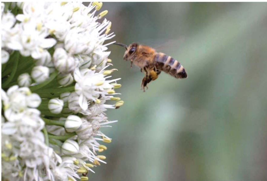
Biene im Anflug auf Zierzwiebel

Salbei, Rosmarin, Lavendel, Pfefferminze, Melisse, Fenchel, Dill, Liebstöckel, Majoran, Oregano, Thymian, Borretsch, Beinwell u.a.