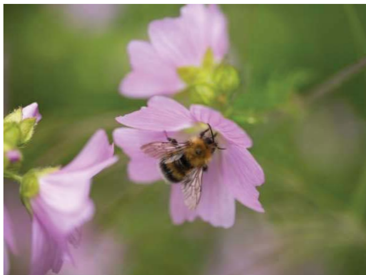
Wildbiene auf Malve

Im Gegensatz zu Honigbienen sind Wildbienen z.T. stark auf einzelne Pflanzen spezialisiert. Die bevorzugten Nahrungspflanzen sind auf die Rüssellänge abgestimmt