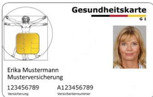
Muster einer Gesundheitskarte (Vorderseite)

Kinder und Jugendliche unter 18 Jahren sind auch von Zuzahlungen für rezeptpflichtige Medikamente und Hilfsmittel (z. B. Hörgeräte) befreit. Brillengläser werden für Kinder und Jugendliche unter 18 Jahren in Höhe der Vertragspreise bezahlt, für Kinder bis 14 Jahre auch bei unveränderter Sehstärke (z. B. auch eine Sportbrille für den Schulsport).