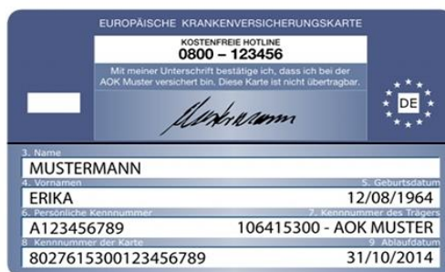
Muster einer Gesundheitskarte (Rückseite)