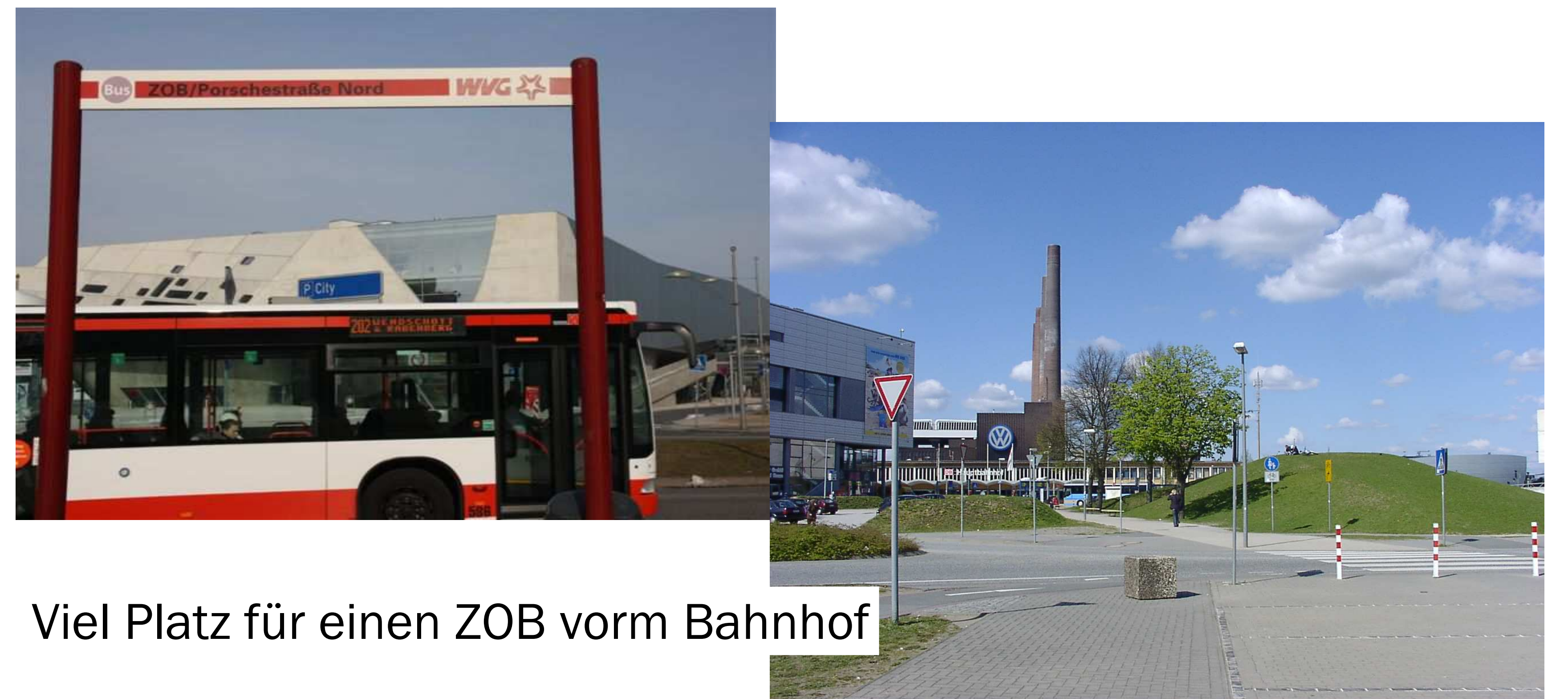
Viel Platz für einen ZOB vorm Bahnhof